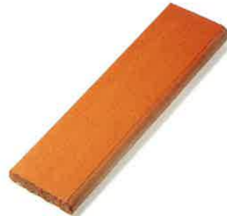
ZÓCALO 27 x 6,5 cm