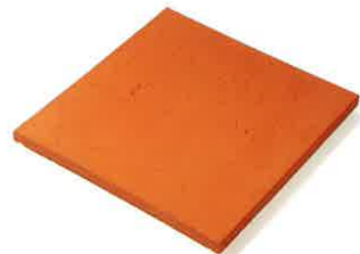
BALDOSA 27 x 27 cm