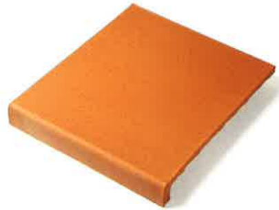
VIERTEAGUAS 27 x 31 cm