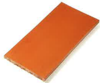
RASILLA 13 x 27 cm