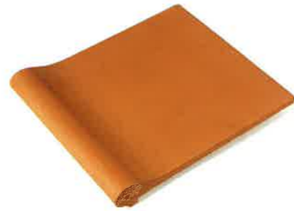
BORDE PISCINA 27 x 31 cm