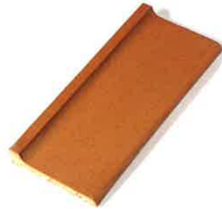
ZÓCALO SANITARIO 27 x 6,5 cm