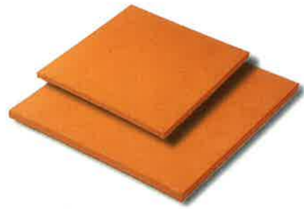
BALDOSAS 27 x 27 cm 36 x 36 cm