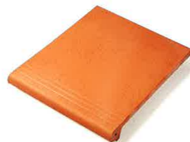
PELDAÑO 27 x 31 cm