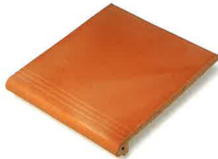
PELDAÑO 27 x 31 cm