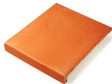
VIERTEAGUAS 27 x 31 cm