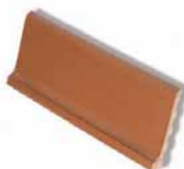
ZÓCALO SANITARIO SANITARY SKIRTING 27 x 11 cm