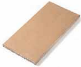
RASILLA TILE 13 x 27 cm