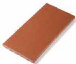
RASILLA TILE 13 x 27 cm