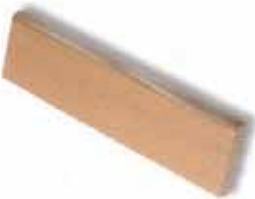
ZÓCALO SKIRTING 27 x 6,5 cm