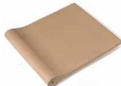
BORDE PISCINA POOL EDGE 27 x 31 cm