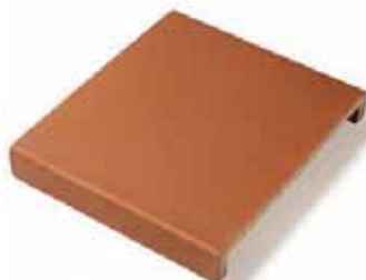
PASAMANO HANDRAIL 27 x 19 cm (int. 15 cm) 27 x 27 cm (int. 23 cm) 27 x 31 cm (int. 27 cm)