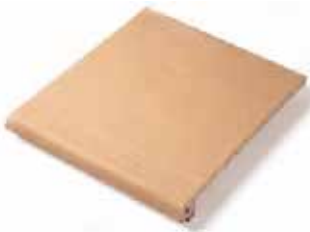
PELDAÑO STAIR 27 x 31 cm