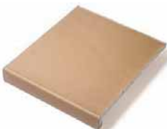
VIERTEAGUAS STEPS 27 x 31 cm