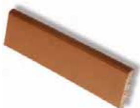
ZÓCALO SKIRTING 27 x 6,5 cm