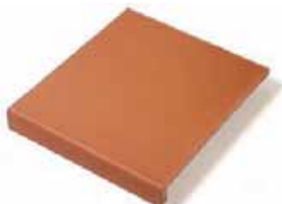
VIERTEAGUAS STEPS 19 x 19 cm 27 x 31 cm