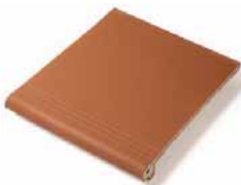
PELDAÑO STAIR 27 x 31 cm