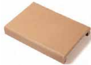
PASAMANO HANDRAIL 27 x 19 cm (int. 15 cm) 27 x 27 cm (int. 23 cm) 27 x 31 cm (int. 27 cm)