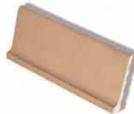
ZÓCALO SANITARIO SANITARY SKIRTING 27 x 11 cm