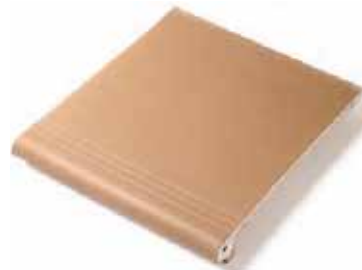
PELDAÑO STAIR 27 x 31 cm