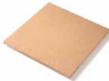
BALDOSA TILE 27 x 27 cm