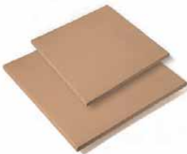
BALDOSA BASE 27 x 27 cm 36 x 36 cm