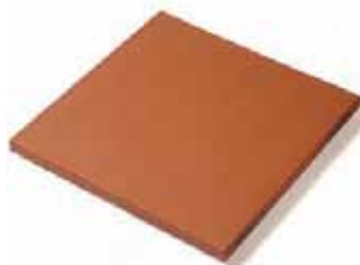
RASILLA TILE 19 x 19 cm