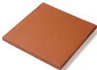
BALDOSA TILE 27 x 27 cm