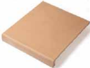
VIERTEAGUAS STEPS 19 x 19 cm 27 x 23 cm 27 x 27 cm 27 x 31 cm